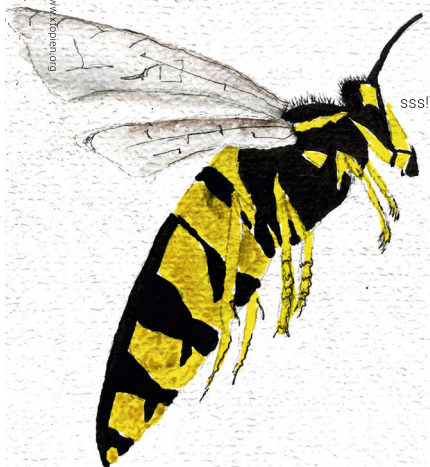
Wespe Vespula vulgaris