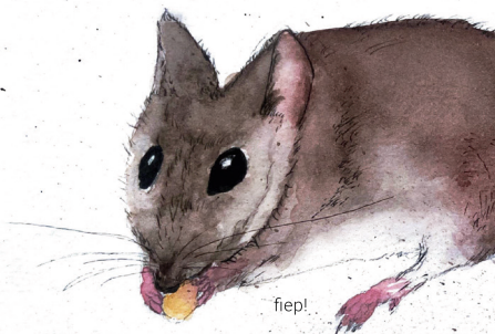
Hausmaus Mus musculus