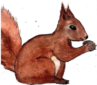
Eichhörnchen Sciurus vulgaris