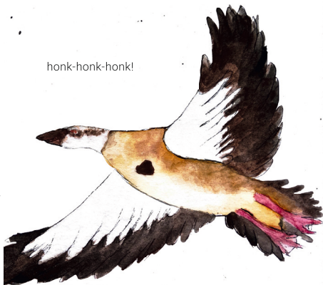
Nilgans Alopochen aegyptiaca