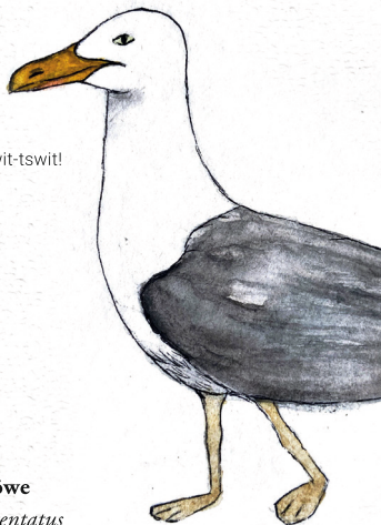
Silbermöwe Larus argentatus